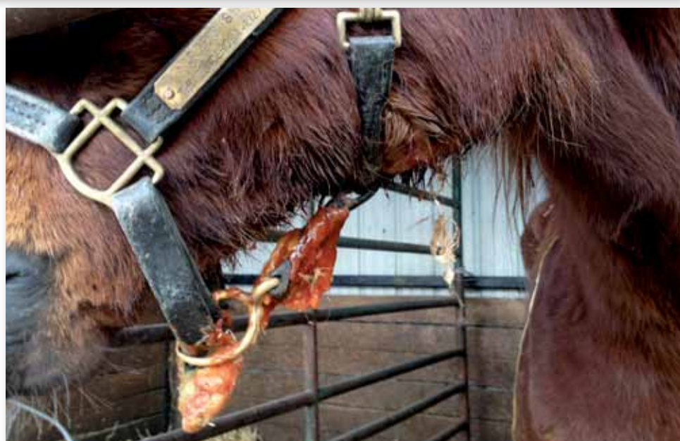
Pferd mit offener Druse, einer hoch ansteckenden, meist tödlich verlaufenden Krankheit.