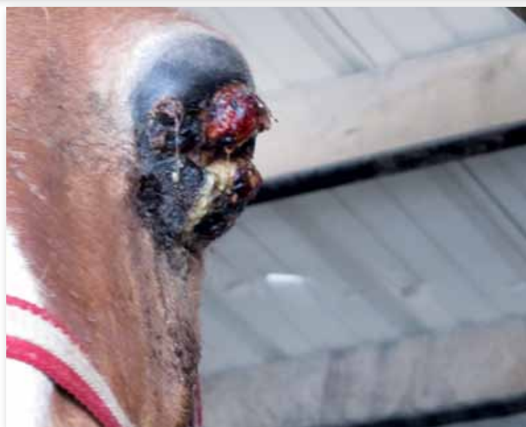
Seit Jahren finden wir auf Auktionen unbehandelte Augenverletzungen. (2011)