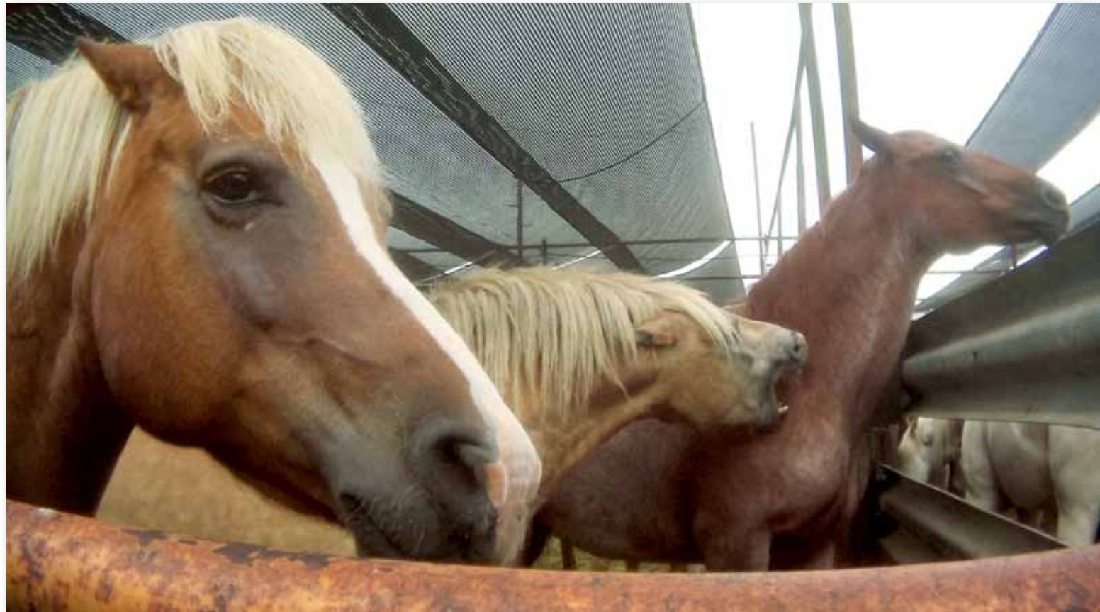
Stress pur in den «kill pens».