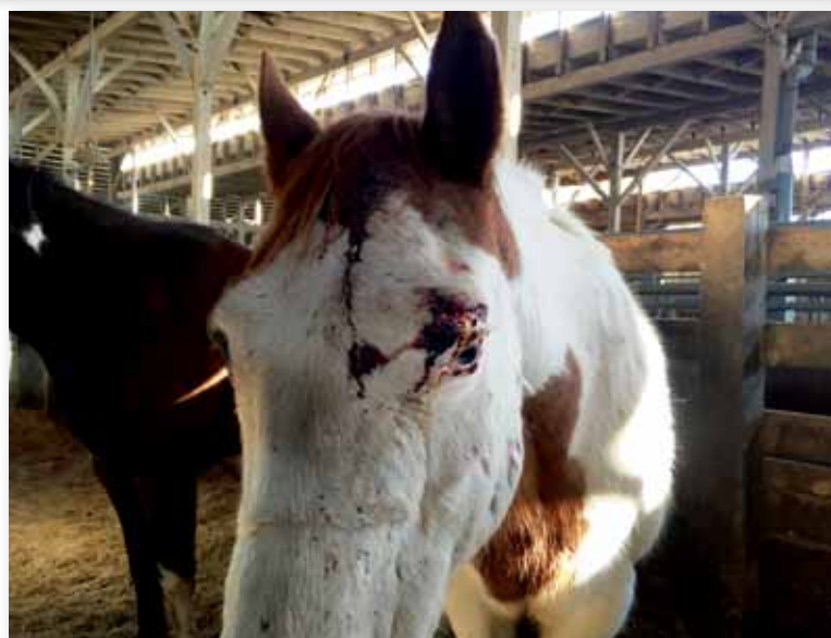
Kopf- und Augenverletzungen, ein sehr häufiger Befund durch Prügel, ungeeignete Transporter und Rangkämpfe. (2016)