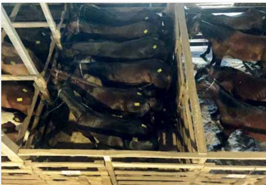
Wie Sardinen zusammengepackte Pferde in einem «kill pen». Ohne Futter, ohne Wasser. Sie bleiben über Nacht und werden am nächsten Tag auf einen Schlachtttransport verladen.