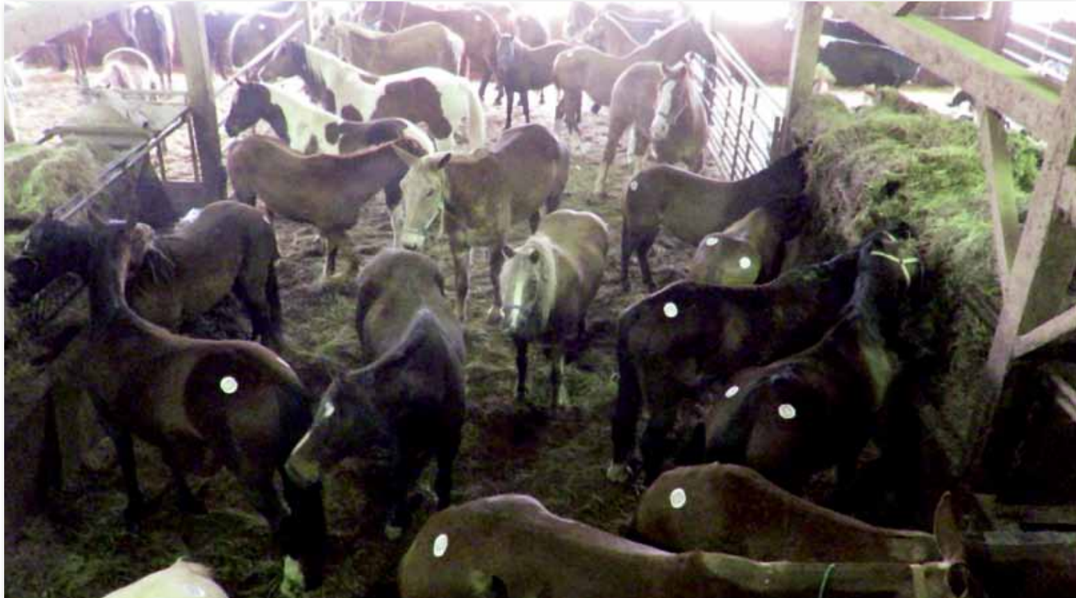
Überfüllter «kill pen». Hier werden laufend Pferde reingesperrt, die von einem «kill buyer» gekauft wurden. Die Pferde sind unruhig, verängstigt und Rankämpfen ausgesetzt.