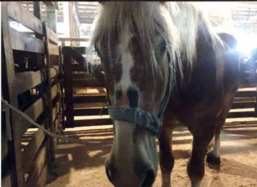
Blutig geschuert auf einem Transport. Medizinische Versorgung gibt es nicht.