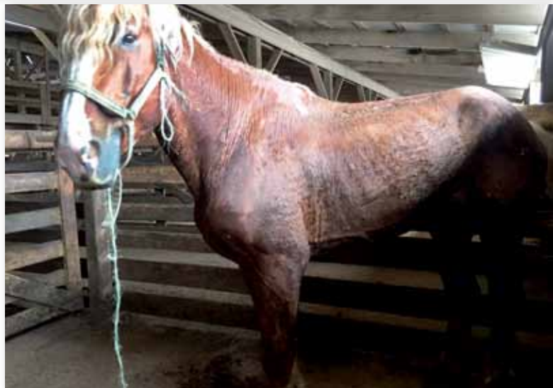
▲ Völlig verwaorlostes Pferd. Sein Fell ist durchtränkt von Gülle.

Für die Amish-Gemeinden dienen Pferde als Auto- und Maschinenersatz. Haben sie ausgedient, landen sie auf Schlachtttransporten.